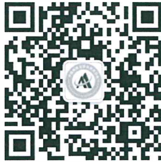
信息分会微信公众号

扫描二维码关注信息分会公众号，点击菜单中“会议报名”按钮进行报名。2019年7月10日之前交费享受优惠。